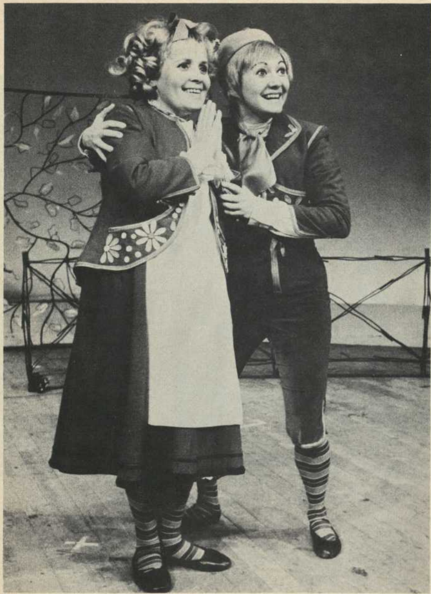
Mytyl — Tytyl