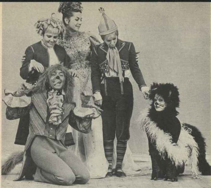
Le Chien - Mytyl - La Fée - Tytyl - La Chatte