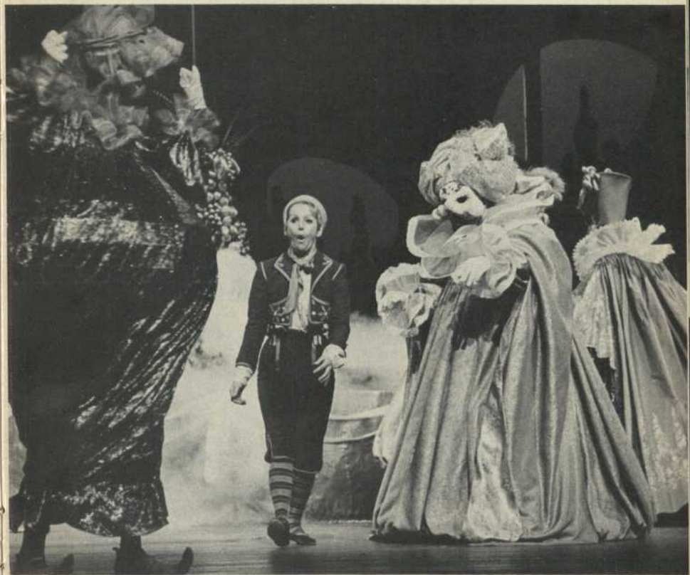
Tyltyl et les Gros Bonheurs