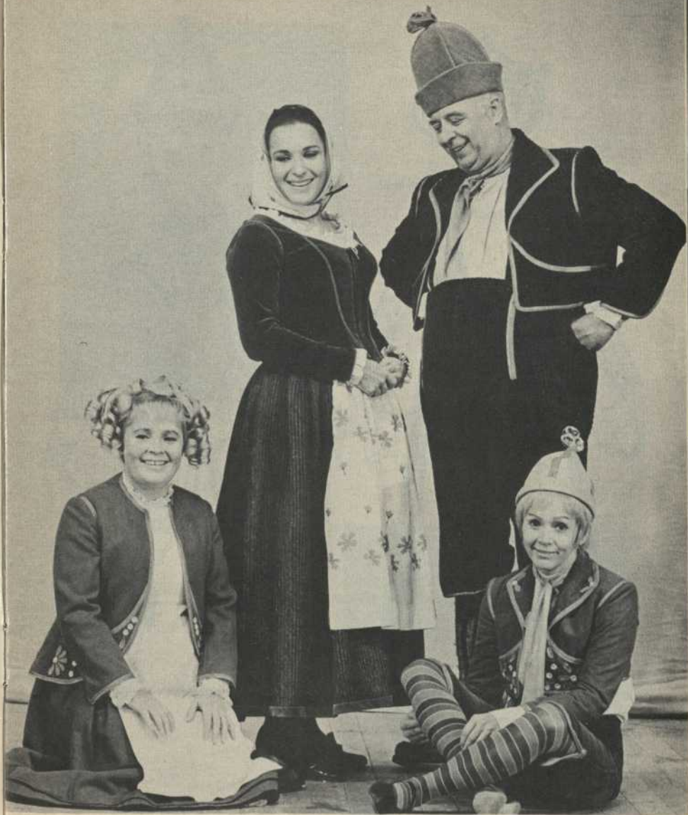
Mytyl – La Mère Tyl – Le Père Tyl – Tytyl