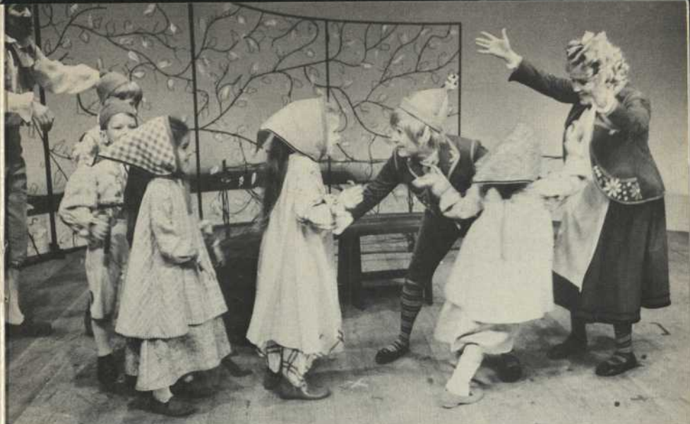
Tylyl, Mytyl et les enfants de la Maison du Souvenir