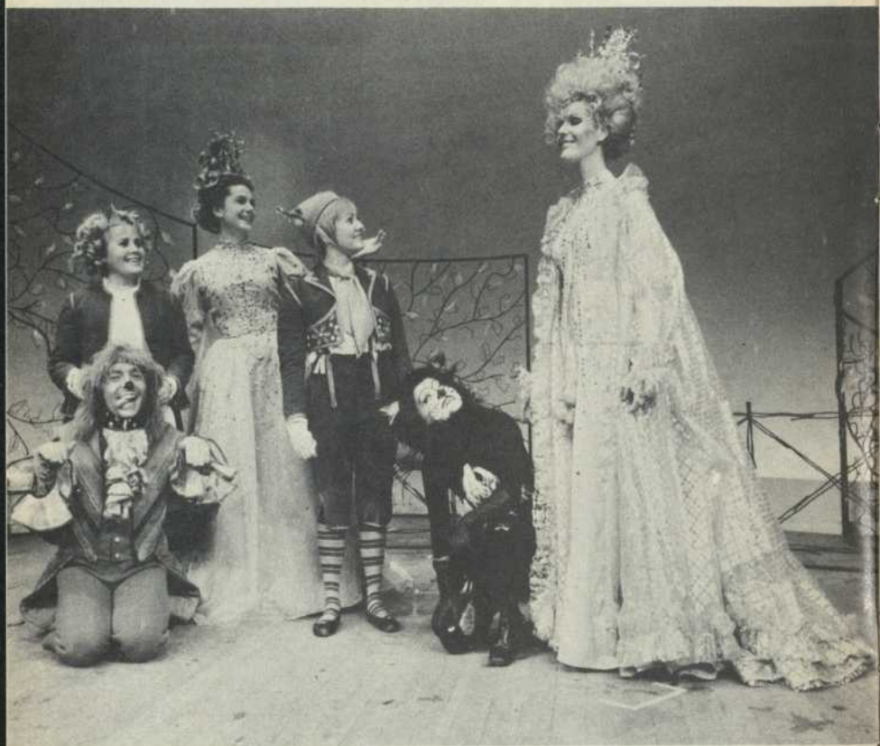
Le Chien – Mytyl – La Fée – Tytyl – La Chatte – La Lumière