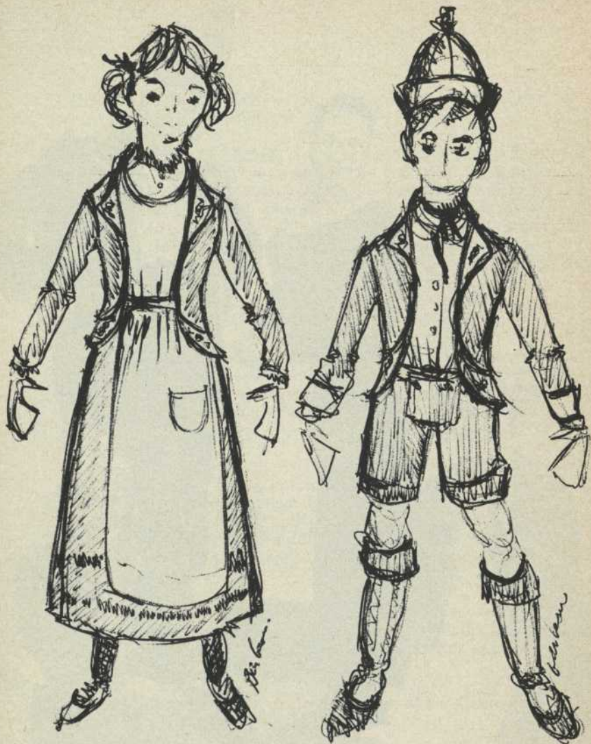
Maquettes des costumes de Mytyl et Tytyl