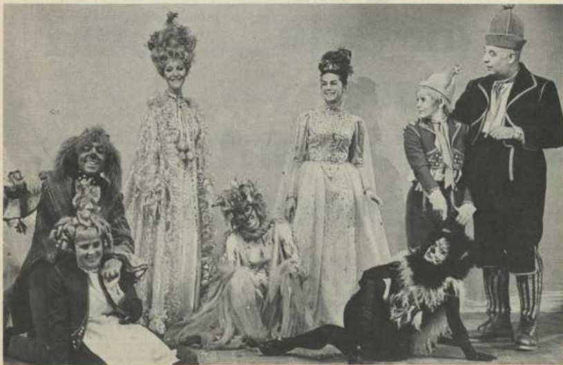
Le Chien - Mytyl - La Lumière - Le Feu - La Fée - La Chatte - Tytyl - Le Père Tyl