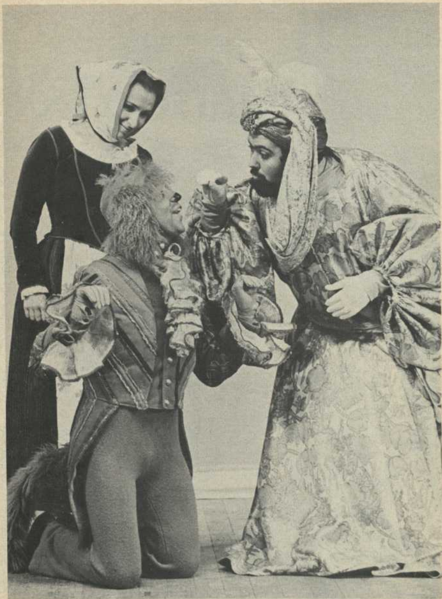
La Mère Tyl — Le Chien — Un Gros Bonheur