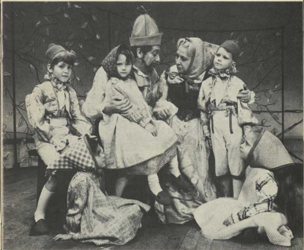
Grand-Père Tyl, Grand' Mère Tyl et les enfants de la Maison du Souvenir