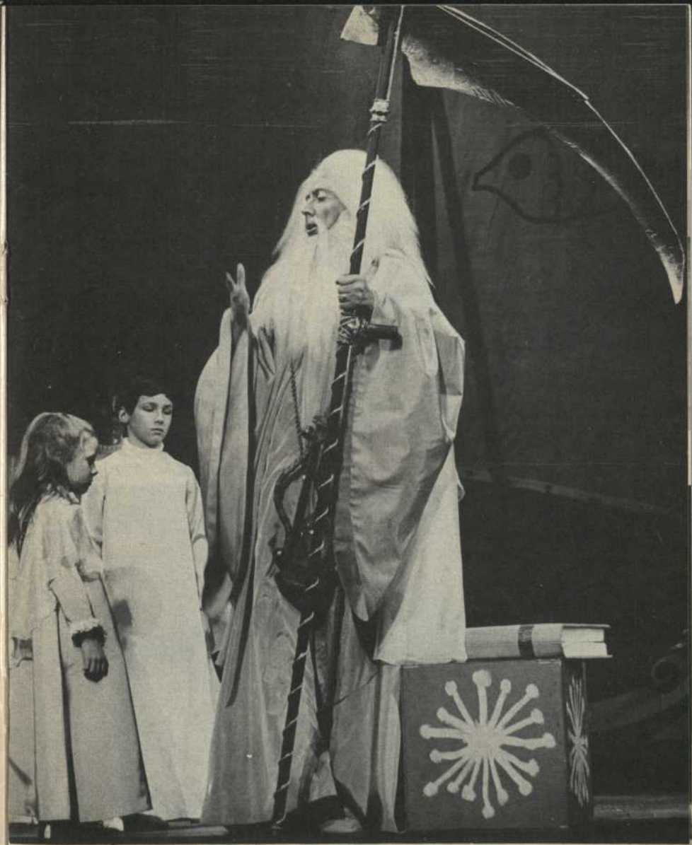
Le Temps au Royaume de l'Avenir