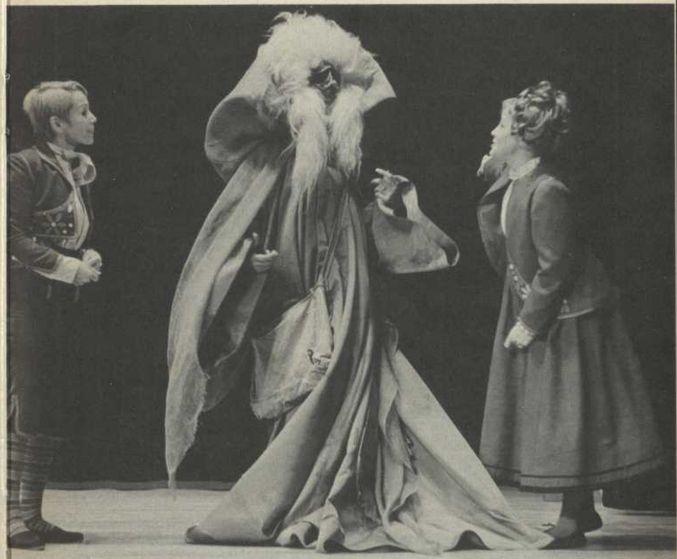
Tyltyl – La Fée – Mytyl